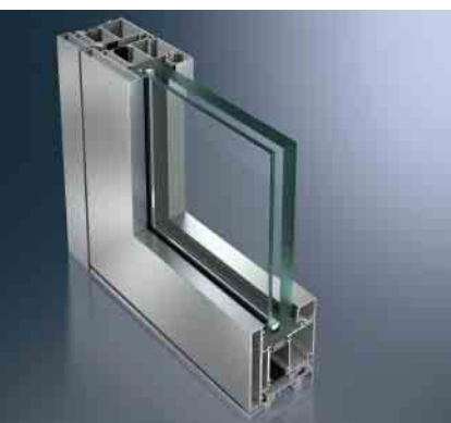
Schüco ADS 90 BR Schüco ADS 90 BR