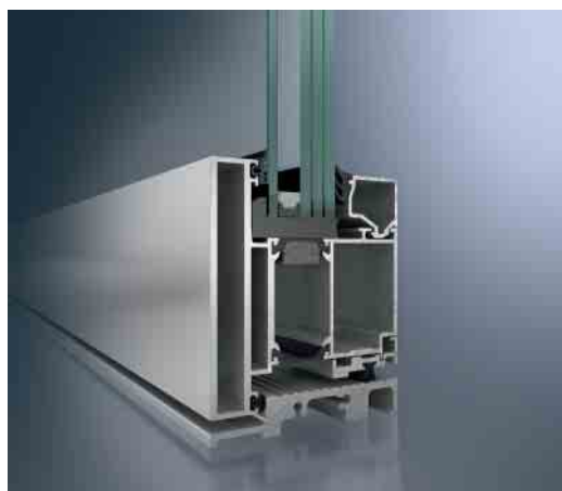
Schüco ADS 90 BR als RC4-Lösung Schüco ADS 90 BR as RC4 solution

Einbruch- und durchschusshemmendes Türsystem Burglar- and bullet-resistant window system