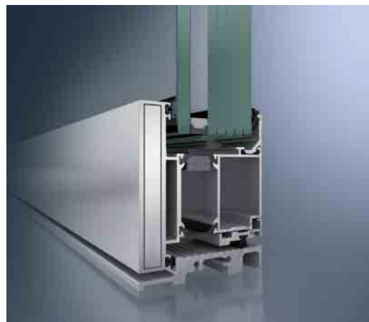
Schüco ADS 90 BR als FB4-Lösung Schüco ADS 90 BR as FB4 solution

Mit dem Schüco Türsystem ADS 90 BR lassen sich einbruch- und durchschusshemmende Anforderungen bis zur Klasse RC4 bzw. FB4 für 1- und 2-flügelige Türen systemtechnisch realisieren. Dabei können wie beim Fenster-system die einbruch- und durchschusshemmenden Eigenschaften bis RC4 mit FB4 problemlos kombiniert werden. Ein weiteres Plus ist, dass diese Anforderungen sowohl mit nach außen wie auch mit nach innen öffnenden Türen erfüllt werden können. Auch hier gilt die Schüco Maxime: Erhöhter Schutz muss nicht sichtbar sein.