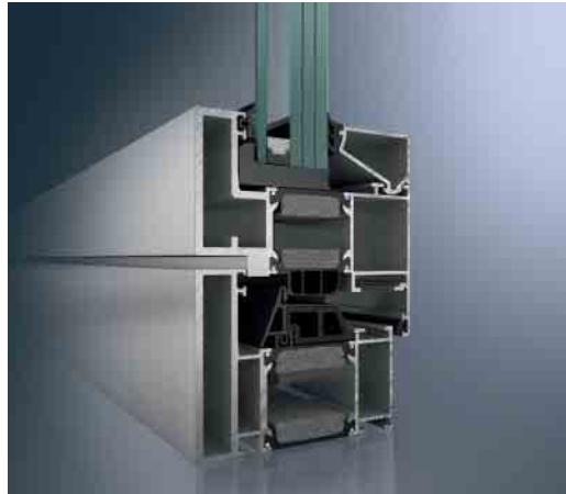
Schüco AWS 90 BR als RC4-Lösung Schüco AWS 90 BR as RC4 solution

Burglar- and bullet-resistant window system