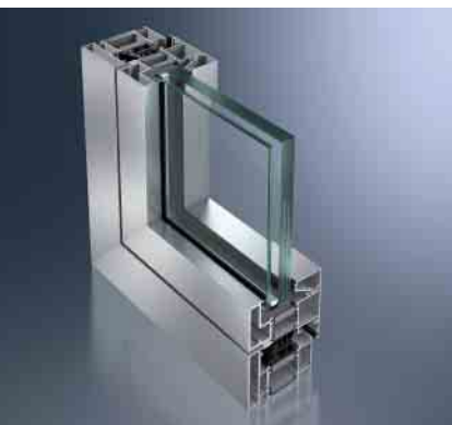
Schüco AWS 90 BR Schüco AWS 90 BR