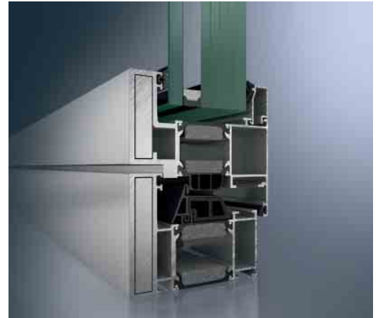
Schüco AWS 90 BR als FB4-Lösung Schüco AWS 90 BR as RC4 solution

Schüco bietet mit den Fenstersystemen AWS 90 BR Systemlösungen für Anforderungen an Einbruchhemmung bis Widerstandsklasse RC4 nach EN1627–1630 oder an Durchschusshemmung bis Klasse FB4 gemäß EN 1522. Dabei besteht die Möglichkeit, diese Eigenschaften bis RC4 und FB4 zu kombinieren. Optisch ist dieses System durch einheitliche Profilansichten nicht von den Standard-Fensterserien zu unterscheiden. Somit lässt sich AWS 90 BR als Hochsicherheitslösung harmonisch in das Gesamtbild eines Gebäudes integrieren.